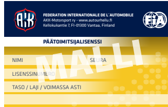
Päätoimitsijalisenssi (vasemmalla vm. 2018 ja oikealla vm. 2024)