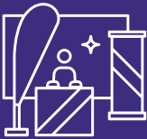
Messut ja tapahtumat