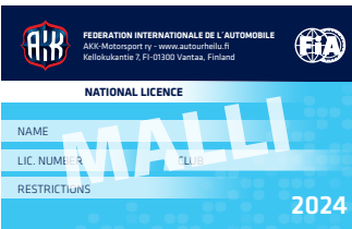
National-lisäkortti kansallisen lisenssin haltijalle.